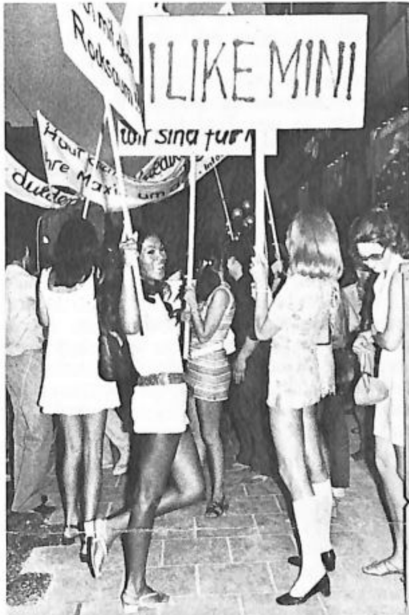
Manifestation pour la mini-jupe à Munich, septembre 1970.