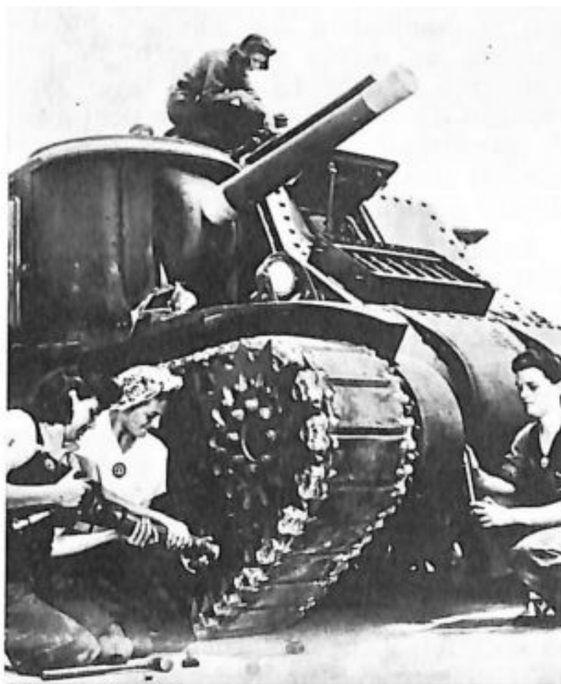
Parmi les grands moments de la "libération" de la femme : les deux guerres mondiales. (Ici : femmes américaines mettant au point un char pendant le conflit de 39-45.)

Ce n'est pas le féminisme, mais le capital, qui jette les femmes dans le salariat et réduit le temps et les efforts consacrés à la fonction maternelle et domestique. Le progrès capitaliste a fait disparaître le rôle de premier plan qu'occupait la force physique humaine. L'énergie devient celle des machines, la violence celle des armes à feu.