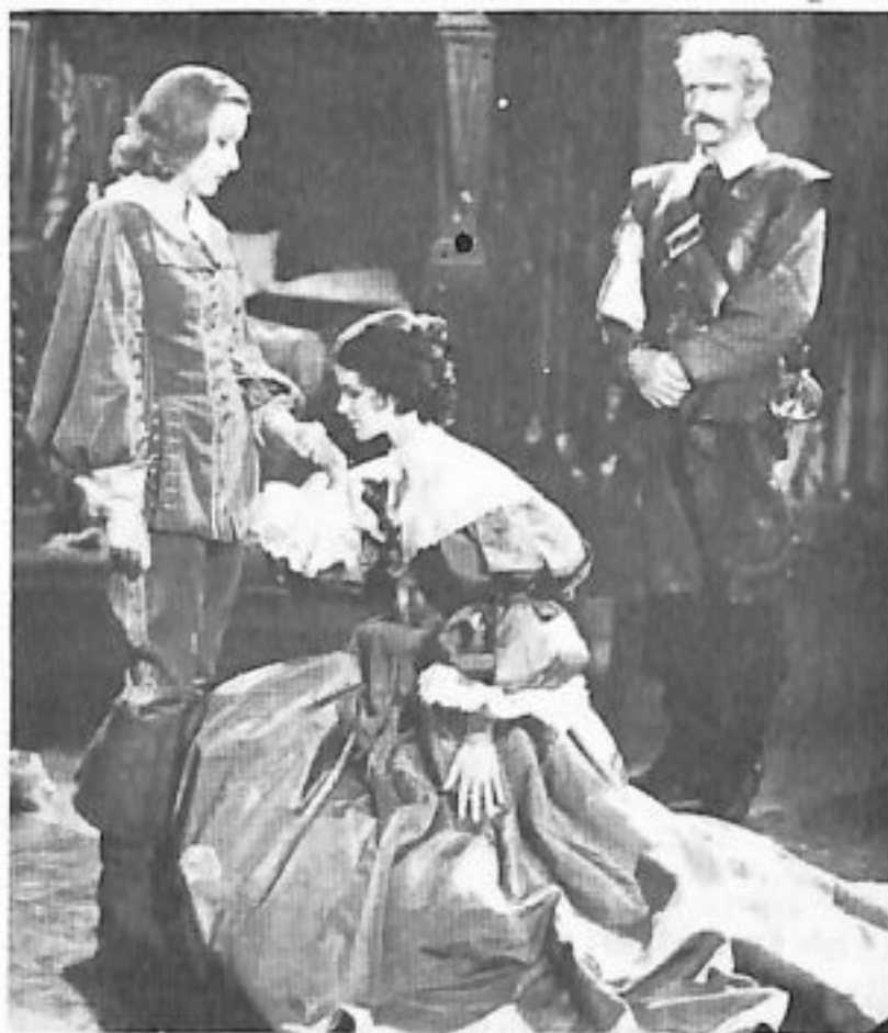
FIGURE 8 – Deux femmes se faisant le baise-main

« Tout cela est fort déconcertant. Comment condamner ces fantasmes qui sont parfois le seul moyen d'obtenir un orgasme, et ne pas constater qu' « ils se trouvent en forte opposition avec la dignité pour laquelle les femmes luttent aujourd'hui » (Emma) ?