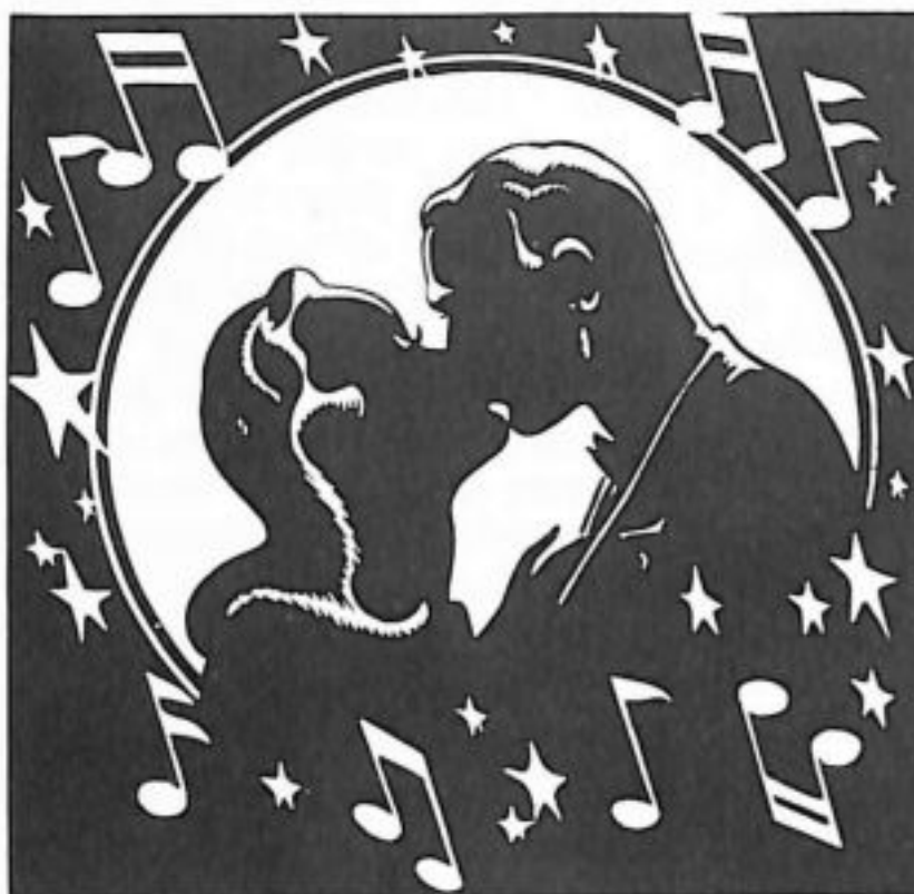
FIGURE 6 – Dessin d'un couple s'embrassant

La sexualité est par excellence le domaine de l'abandon. Il s'agit d'être " ravi", "captivé", de se délivrer de soi-même pour être emporté par sa propre passion et s'abandonner à celle de l'autre.